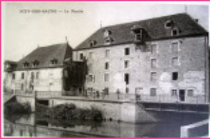
1. Le moulin vu de la rue d'Enfer