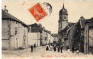
14. Rue de l'église