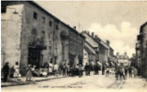
4. Rue Armand Paulmard (vers l'actuel office de tourisme)