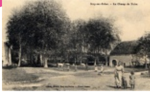
8. Avenue de Verdun (avant 1957-58)