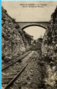
15. Rue de la Prouse (l'ancienne voie ferrée. Le tramway a circulé de 1910 à 1937 sur la ligne de Vesoul à Molay soit pendant 27 ans et 3 mois)