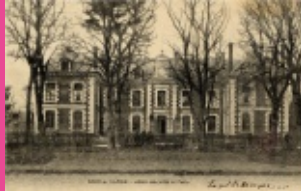
12. Avenue des Patis (la mairie)