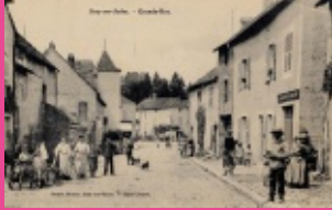
7. Grande rue du Bourg (vers la rue A. Paulmard, vers 1930-1940)