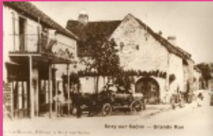
6. Grande rue du Bourg (vu de la rue A. Paulmard, vers 1930)