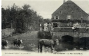
13. Rue du Petit Moulin (Le pont de la Motte)