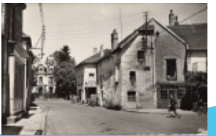
5. Rue Armand Paulmard (vers l'actuelle bibliothèque, vers 1930)