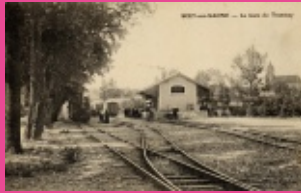
11. Place des Patis (la gare, inaugurée le 28 sept 1910 détruite en 1969)