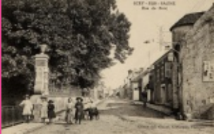
2. Rue Armand Paulmard vue du pont (avant 1909 construction de la voie ferrée)