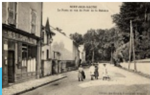
10. Rue du Pont de la Balance (l'ancien bureau de Poste)