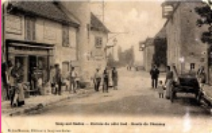
3. Rue Armand Paulmard vers le pont (avant 1909 construction de la voie ferrée)