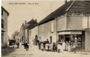
9. Rue Armand Paulmard (vue du carrefour)