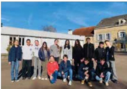
Les élèves allemands et français au collège Château Rance – Scey-sur-Saône

germanistes ont accueilli les jeunes de Dornstetten chez eux et nous remercions une nouvelle fois les familles pour leur accueil. Au programme : découverte de Besançon et visites de musées, moments conviviaux, cours au collège et surtout de belles occasions de pratiquer le français et l'allemand... parfois dans la même phrase !