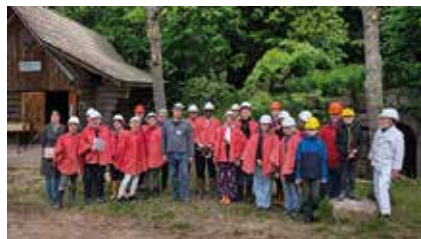
Visite de la mine « Bergwerk » à Hallwangen

casques, galeries et anecdotes historiques, nous avons découvert un pan du patrimoine local — tout en poursuivant nos échanges dans la bonne humeur.