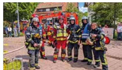
Exercice incendie avec les sapeurs-pompiers français et Feuerwehrmänner

Après le repas, les pompiers de Dornstetten ont invité leurs homologues sceycolais à participer à un exercice incendie, renforçant encore leur amitié. Cela a permis aux pompiers français et allemands de comparer leurs techniques... et leurs camions. Déjà, ils prévoient de se retrouver l'an prochain à Scey-sur-Saône pour une nouvelle rencontre, sûrement tout aussi conviviale que professionnelle.