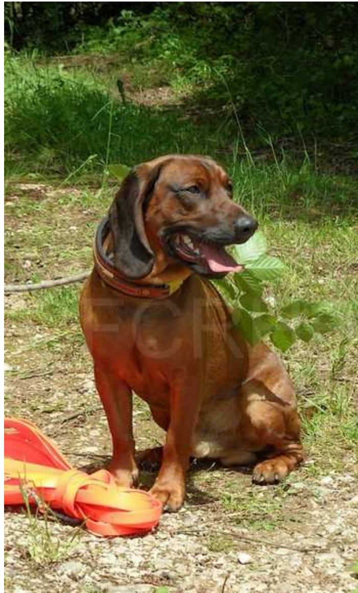
Lutti des Bruyères des Trois Crocs, meilleur chien de la journée