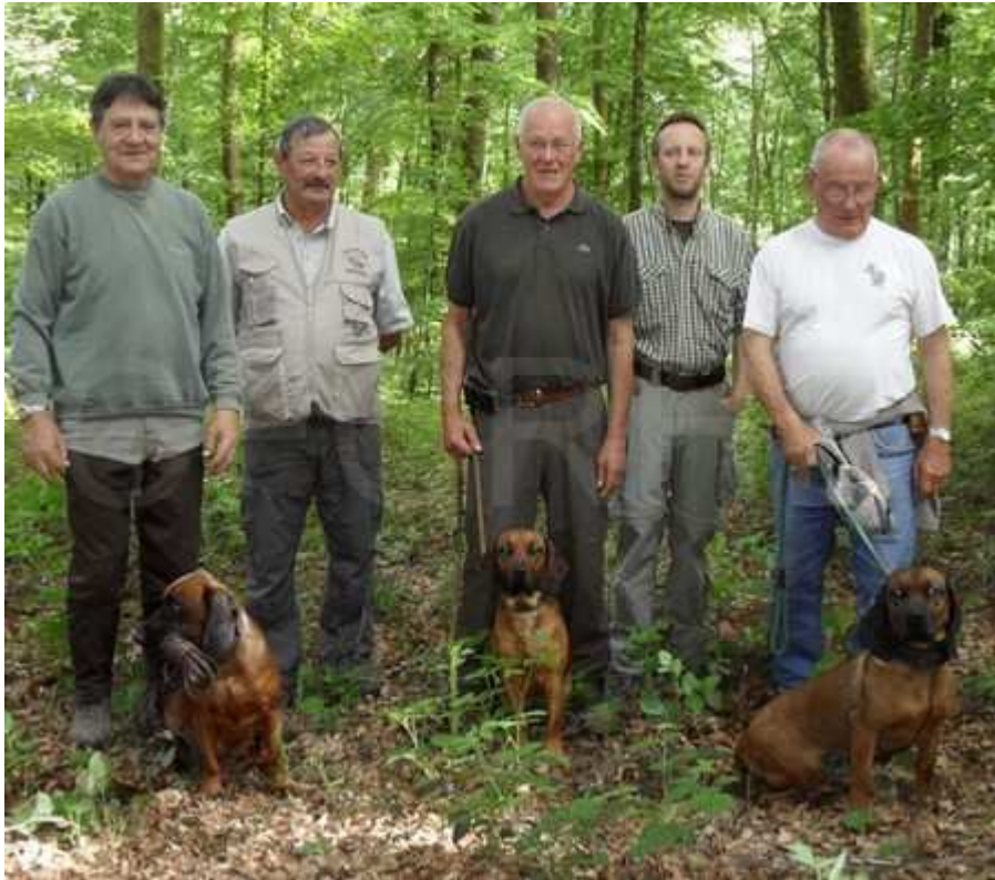
La réussite du groupe 1, jugé par C. Missland et D. Duvoid